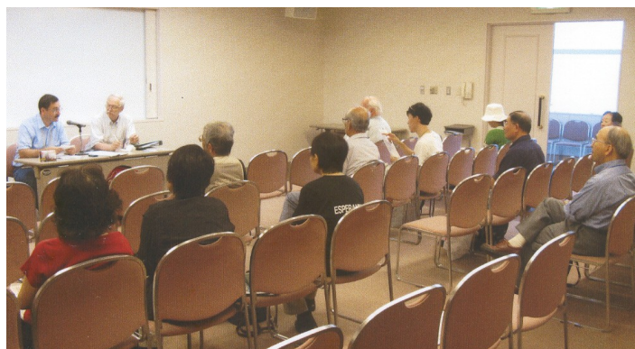
Aŭskultantaro dum la ILERA Jarkunsido 2007